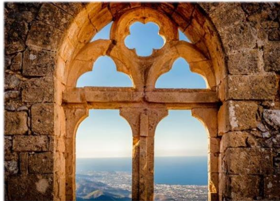
La fenêtre de la reine au château de Saint Hilarion

www.scope-voyage.fr info@scope-voyage.fr